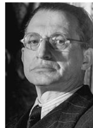
Алкід де Гаспер